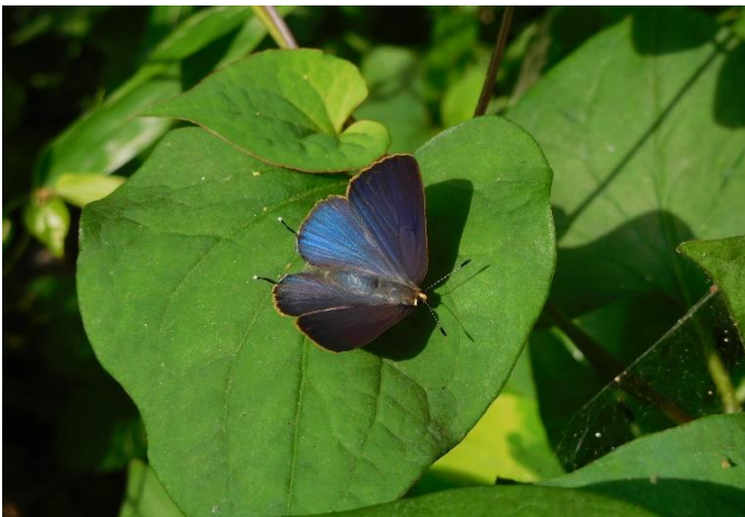
生田緑地 6月中旬 葉上で占有行動