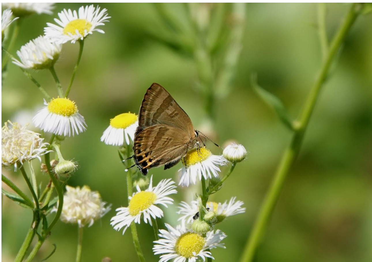
山梨県韮崎市 7月上旬（夏型） ヒメジョオン花で吸蜜