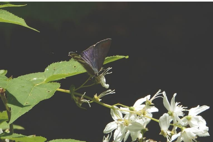
奥多摩日原 5月中旬 (春型) ウツギの花で吸蜜