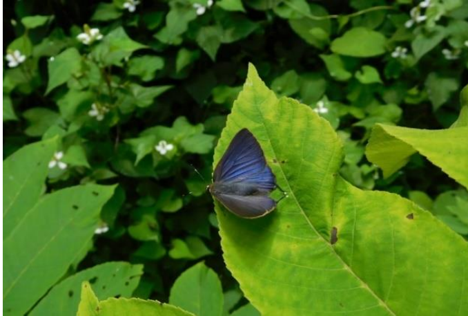
生田緑地 6月初旬 葉上で占有行動