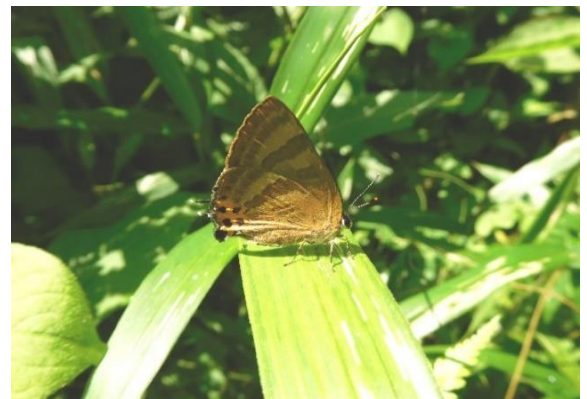
生田緑地 6月中旬 名前の由来の虎模様 (夏型)