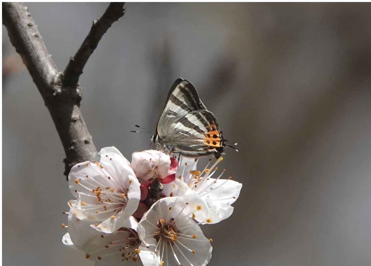
横浜市森林公園 3月下旬（春型） アンズの花で吸蜜