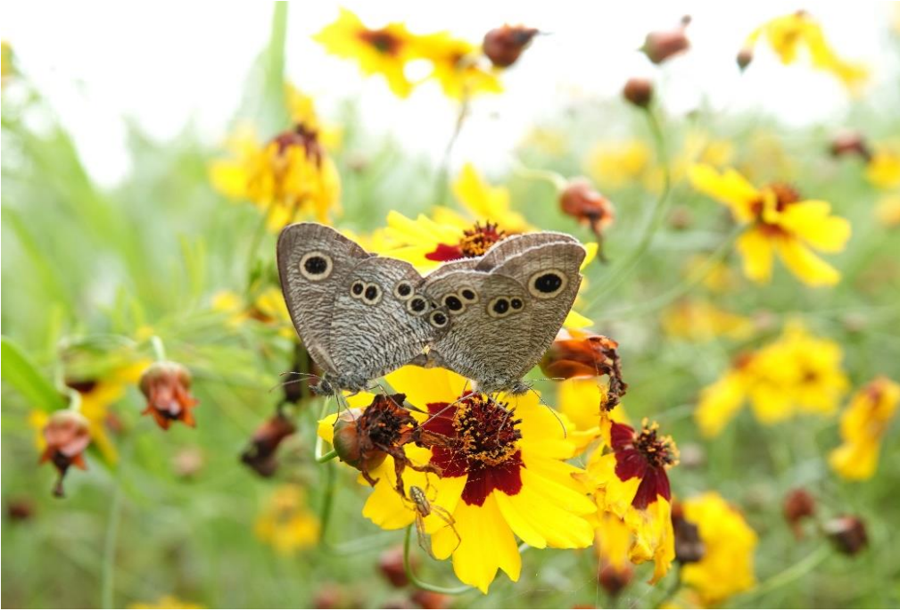
190713 多摩川稲田堤 ハルシャギク