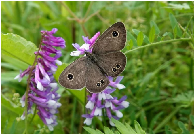
多摩川土手 中野島 5月初旬 ナヨクサフジで吸蜜