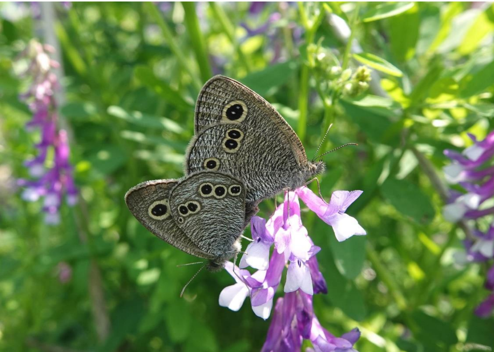
220505 多摩川中野島 ナヨクサフジ