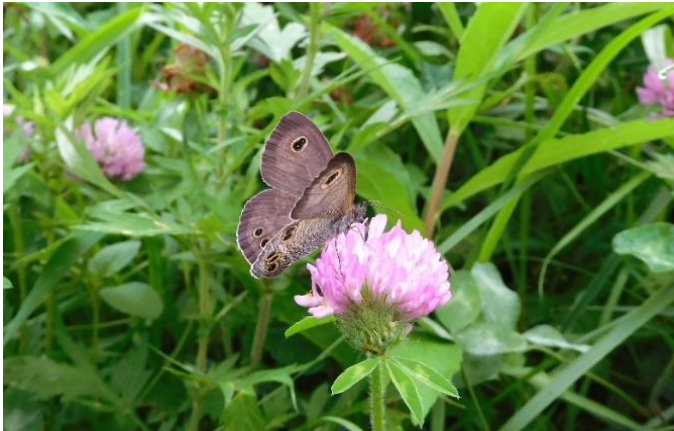
多摩川土手 中野島 7月中旬 アカツメクサで吸蜜