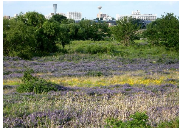
多摩川土手 中野島 5月中旬 ナヨクサフジ(紫)とキバナコスモス(黄)

ジャノメチョウの仲間は共通して、羽の表、裏、或いは両方に「蛇の目」とされる眼状紋があります。明るい草地を好む本種は4月末頃出現し、5月中旬に多摩川を紫に染めるナヨクサフジで盛んに吸蜜します。