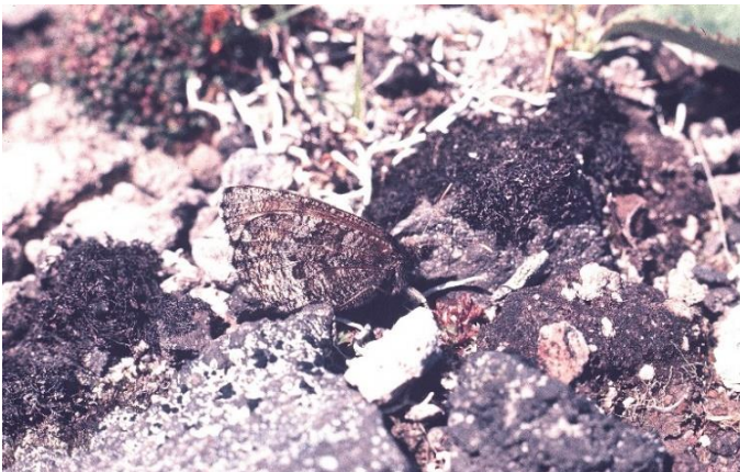
ダイセツタカネヒカゲ(天然記念物) 大雪山北海岳 7月中旬 風がなくても地面にとまる時は体を横たえる