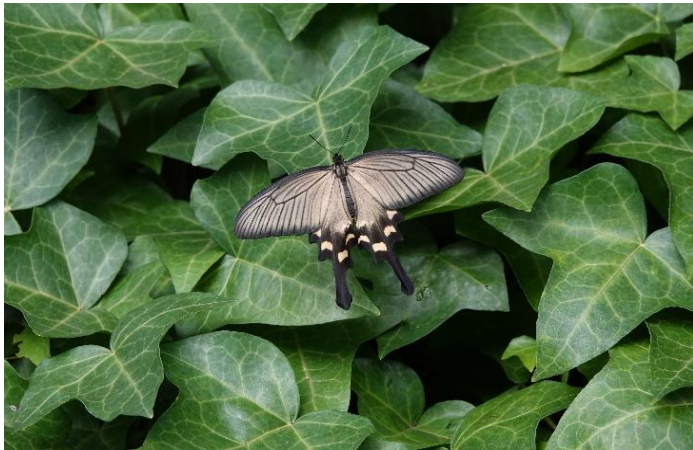
ハイム内 中野島 9月初旬♀ ♀は暗灰色で♂は黒い