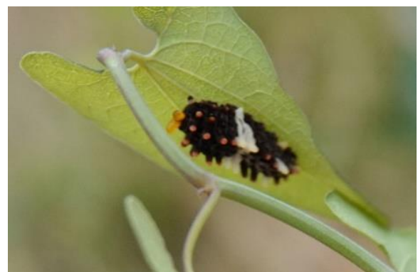
多摩川土手 登戸 5月下旬 食草「ウマノスズクサ」と3齢幼虫

よく似たオナガアゲハ、クロアゲハ、アゲハモドキ（蛾）はこのジャコウアゲハに擬態して身を守っていると言われていました。また、蛹は江戸時代の怪談「番町皿屋敷」に出てくる大事な皿を割ったために後ろ手に縛られている「お菊」という女中さんの姿を髣髴させるとして「お菊虫」と呼ばれます。