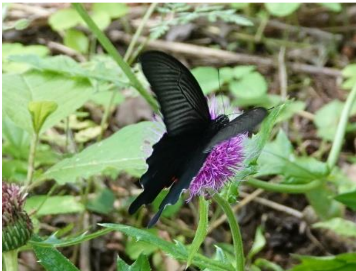
津久井城山公園 6月初旬♀ ノアザミで吸蜜