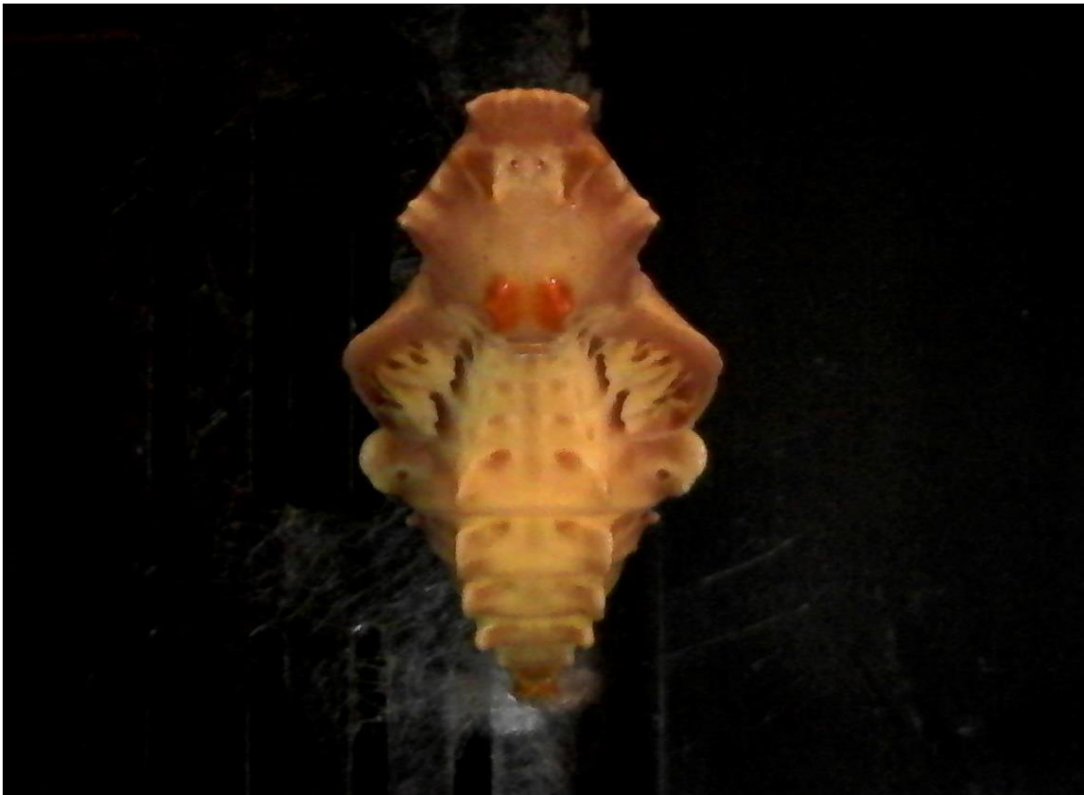
「お菊虫」と呼ばれる蛹 中野島 11月上旬