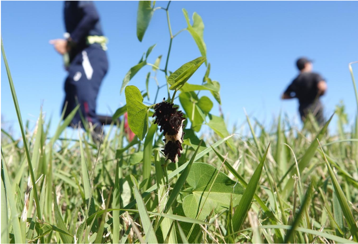
終齢幼虫とウマノスズクサ 多摩川土手 中野島 10月下旬