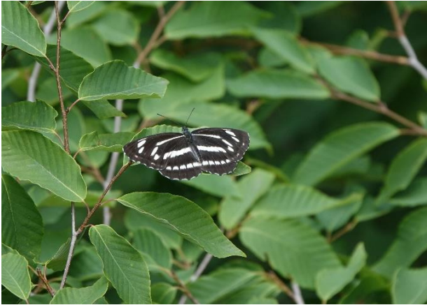
ミスジチョウ 八王子市 5月下旬