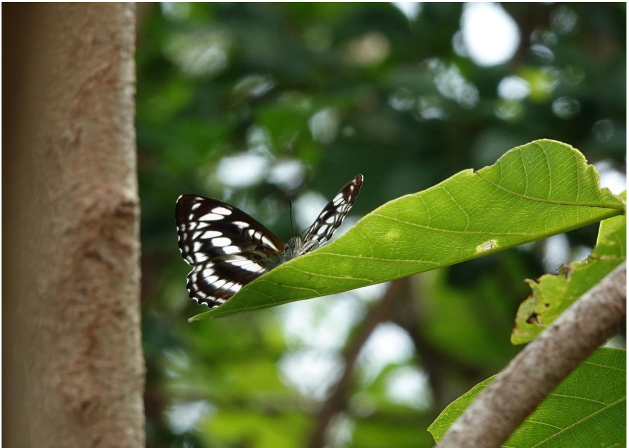
ヤエヤマイチモンジ ♀ 石垣島 2月中旬