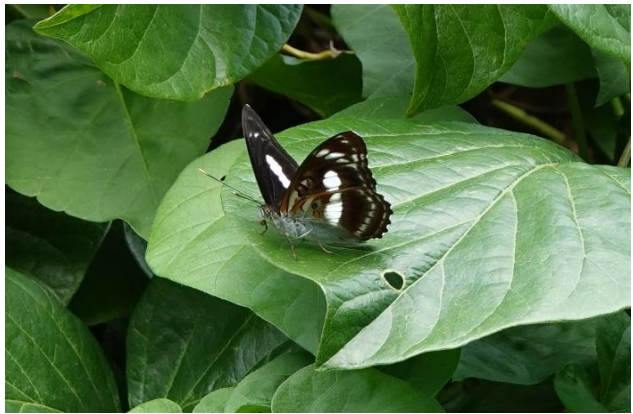
ヤエヤマイチモンジ ♂ 石垣島 2月中旬