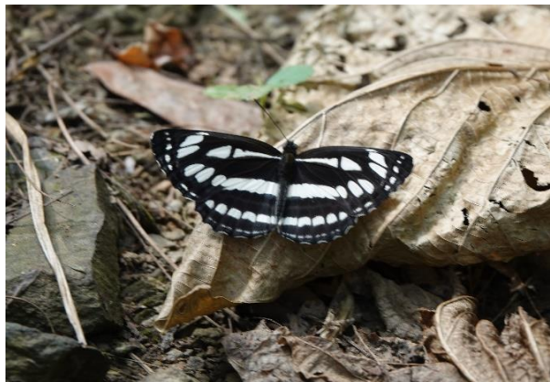
リュウキュウミスジ 石垣島 2月中旬