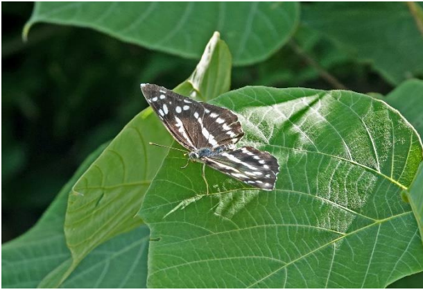
オオミスジ 7月中旬 山梨県