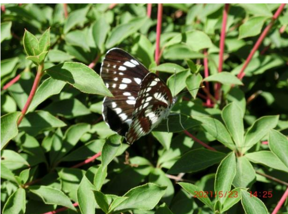
ホシミスジ ハイム 5月下旬 長い間ハイムにはいないと思っていたがいた！ ユキヤナギを食す