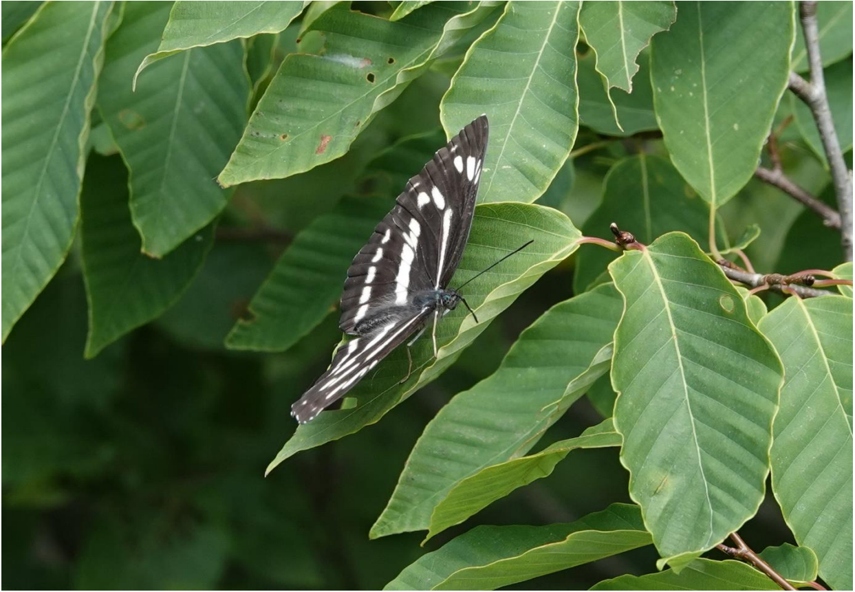
ミスジチョウ 八王子市 5月下旬