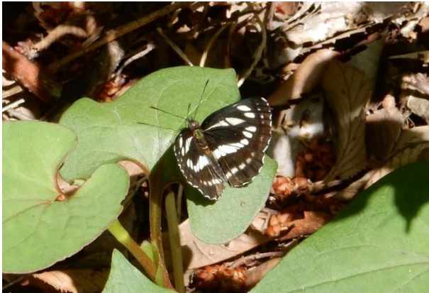
生田緑地 4月下旬 ドクダミの葉にとまる