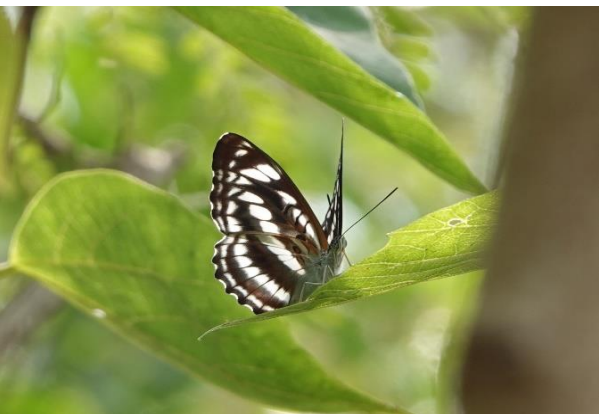
ヤエヤマイチモンジ ♀ 石垣島 2月中旬