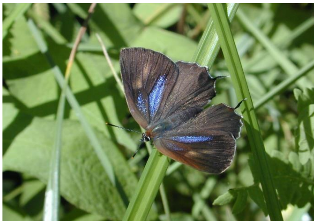
生田緑地 6月中旬 ♀ 橙と青の斑が出たAB型