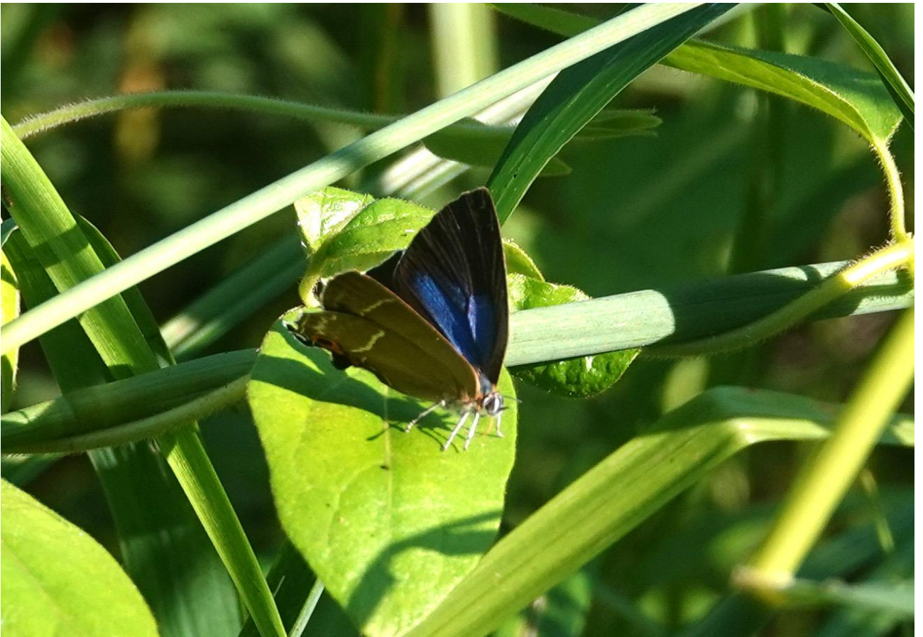
秋が瀬公園 6月上旬