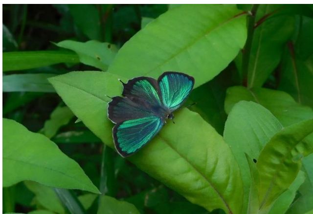
生田緑地 5月下旬 ♂ 曇っているとしっとりとした色に光る