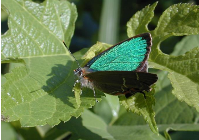
生田緑地 6月中旬 ♂