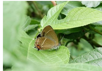
生田緑地 6月上旬 ♀ オスもメスも裏は地味