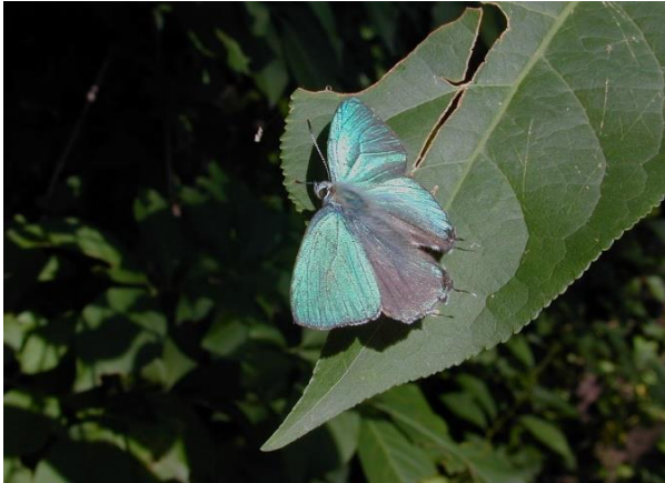
生田緑地 6月上旬 ♂