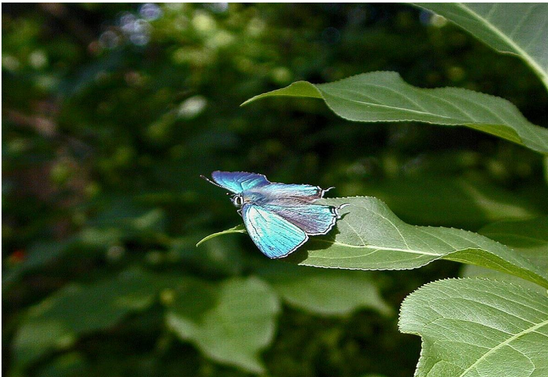
生田緑地 6月上旬 ♂

初夏から梅雨時にかけて、「ゼフィルス」(西風の精)という愛称で親しまれている一群の蝶がいます。その中でも特にミドリシジミたち(x x ミドリシジミという蝶が日本に13種類います)のオスは自らのテリトリーを守るため占有行動、即ち、自分の領域に他のオスが入ってくると追尾して追いだそうとします。この際に二頭、三頭がクルクル旋回しながらもつれあい、卍巴(まんじどもえ)でしばらくの間キラキラと輝きながら飛ぶ光景は見飽きることがありません。オオミドリシジミは都市近郊にも見られ、生田緑地でも少なくともはなりましたがその姿をみることができます。オスの活動は早朝で、メスは目立たない濃灰色です。