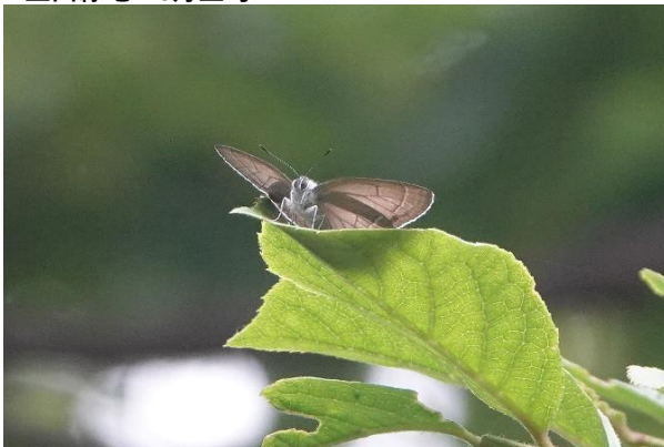
生田緑地 6月上旬 ♂ 樹の上 (6~7m) だと羽の裏しか見えないが最近なかなか下に降りてこない