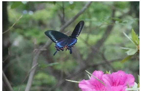
高尾山 5月下旬 オオムラサキツツジに訪花する♂