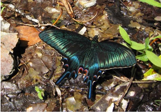
奥多摩日原 5月下旬 ♂の単独吸水