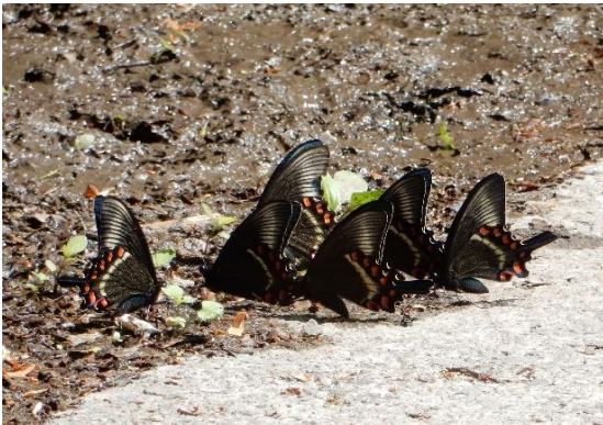
奥多摩日原 5月下旬 ♂の小集団吸水。後羽白帯が特徴