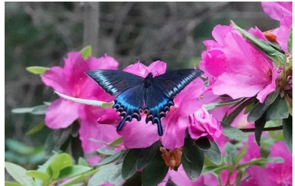
高尾山 5月下旬 オオムラサキツツジで吸蜜する♂

日本で最も美しい蝶と言われることが多いのがこのミヤマカラスアゲハです。カラスアゲハの項で紹介しましたが、残念ながら生田緑地を始めハイム周辺で会うことは出来ません。奥多摩の日原付近や高尾山に毎年撮影に行きますが、溪流沿いの道に沿って蝶道と呼ばれる一定のコースを飛ぶ習性があり、オスはツツジ等の花を訪れるほかに頻繁に水溜まりや、濡れた道路路面で吸水し、時として大集団になることがあります。一方、メスはツツジ、クサギ等の花に飛来して吸蜜します。奥多摩、高尾山では本種とカラスアゲハの両方が見られます。