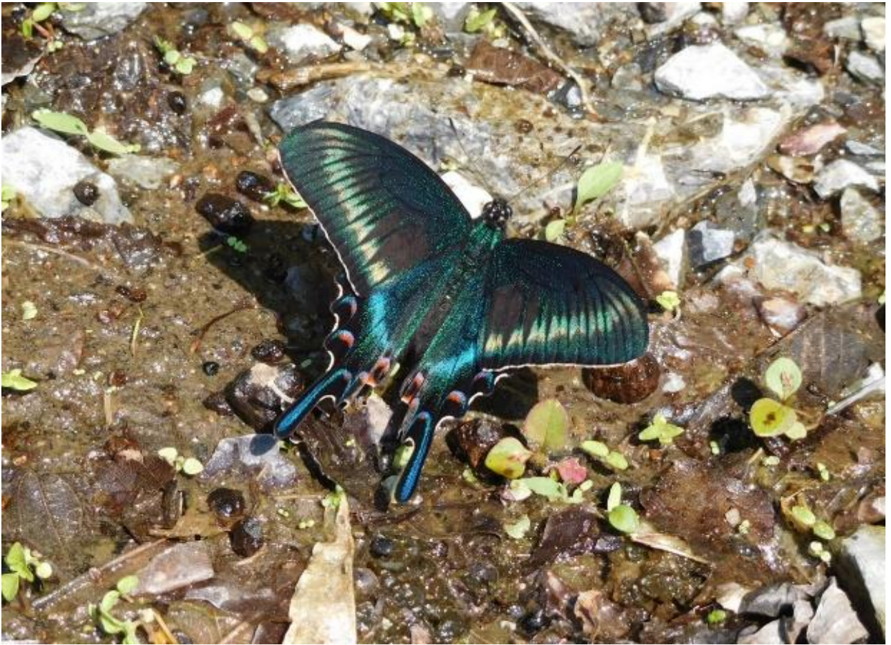
170523 奥多摩 日原川