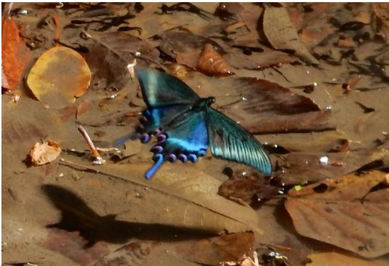
奥多摩日原 5月下旬 水場に飛来する♂