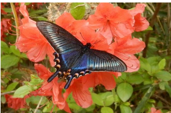
高尾山 5月中旬 レンゲツツジで吸蜜する♀