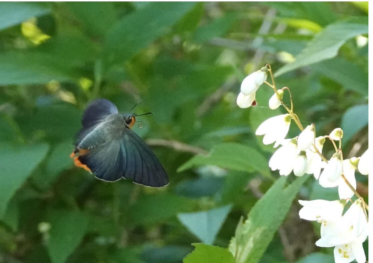
生田緑地 4月下旬 ウツギに飛来