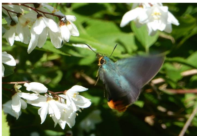
生田緑地 5月初旬 ウツギに飛来