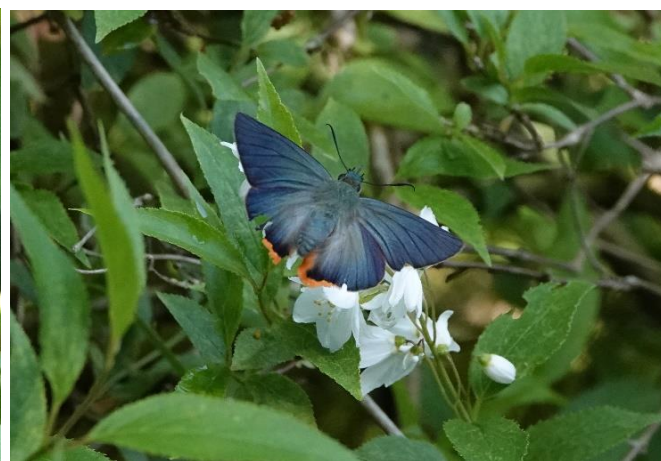
生田緑地 4月下旬 ウツギに飛来。独特の金属光沢

セセリチョウの重鎮です。アオバセセリを含めセセリは一般的に飛ぶのが速いのですが、花を訪れて吸蜜するときだけはゆっくりと観察することが出来ます。