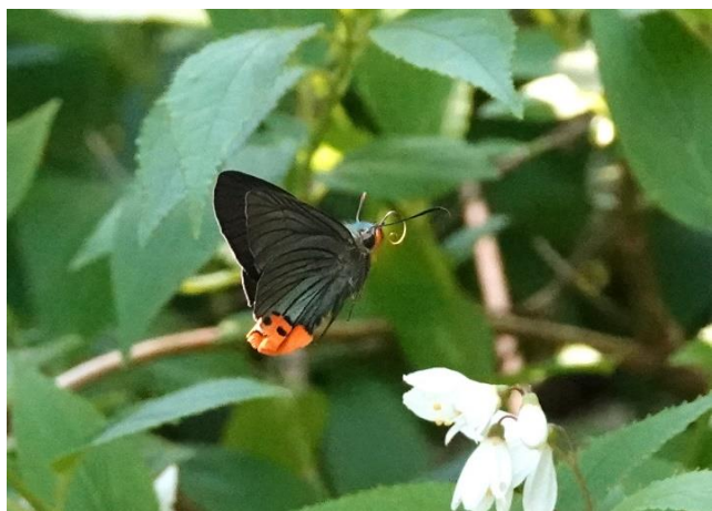
生田緑地 4月下旬 ウツギに飛来