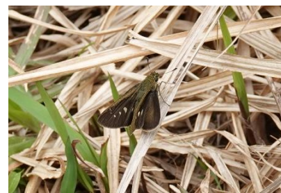
ユウレイセセリ 2月中旬 石垣島