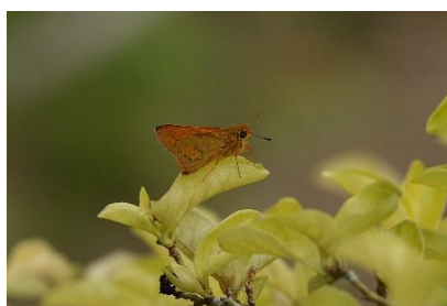
ネッタアカセセリ 2月中旬 石垣島