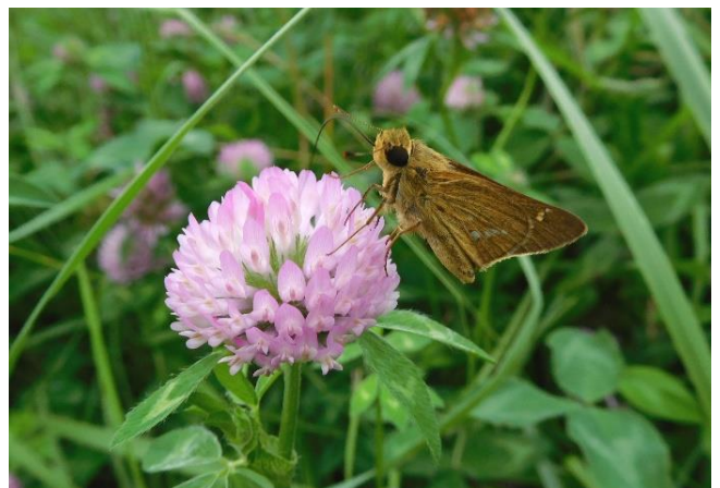
多摩川土手 中野島 7月中旬 イチモンジセセリ アカツメクサで吸蜜 後羽の白紋が大きく一直線状に並ぶ

初夏から晩秋にかけて普通にハイム内でも見かけるセセリチョウでいろんな花で吸蜜しますが、代表格のセセリチョウであるイチモンジセセリと極めてまぎらわしく飛んでるところではどちらかはわかりません。違う点：最もはっきりするのは後羽裏側の白い紋列がイチモンジセセリがその名の通り、一直線状に並ぶのに対して、チャバネセセリは小さな白い紋が弧状に並びます。従ってとまって羽を閉じてくれないとなかなか見分けることができません。