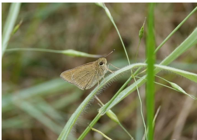
多摩川土手 中野島 5月下旬 チャバネセセリ 後羽の白紋が小さく、弧状に並ぶ