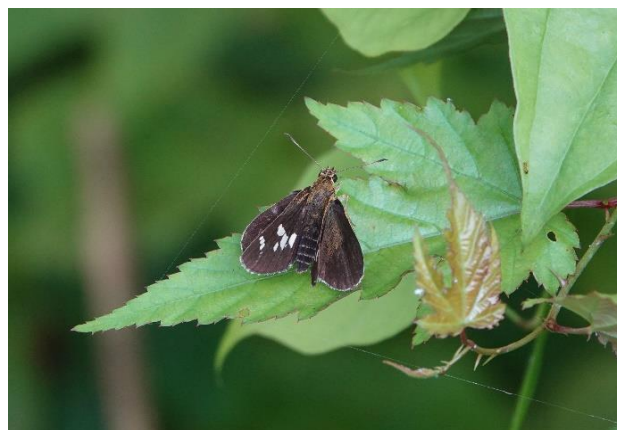
ホンバセセリ 8月上旬 高尾山