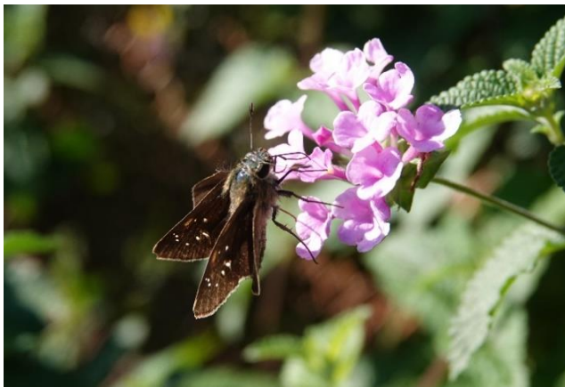
多摩川土手 稲田堤 11月上旬 ランタナで吸蜜