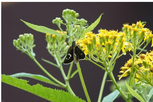
オオチャバネセセリ キオンで吸蜜 8月上旬 上高地