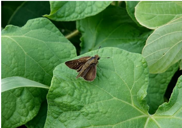
多摩川土手 中野島 8月末