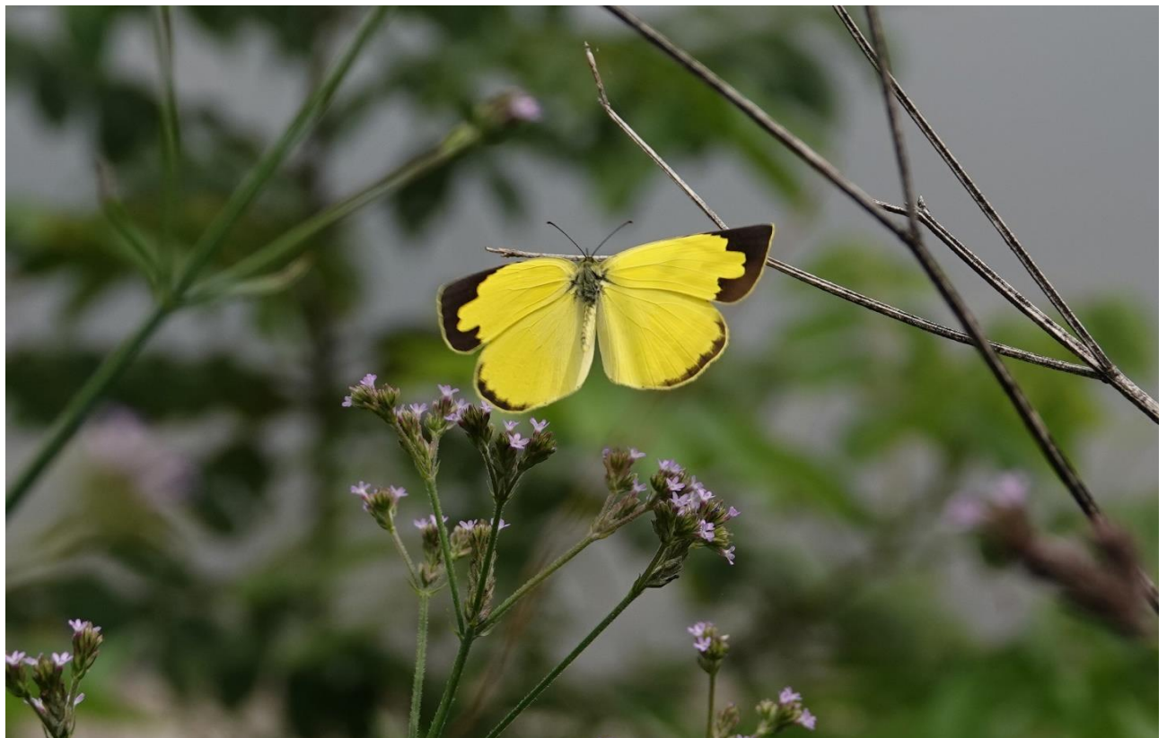
多摩川土手 稲田堤 7月初旬 アレチハナガサに飛来