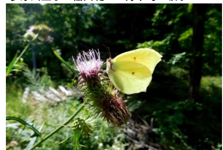
スジボソヤマキチョウ 8月下旬 長野県南佐久郡 ミヤコアザミで吸蜜