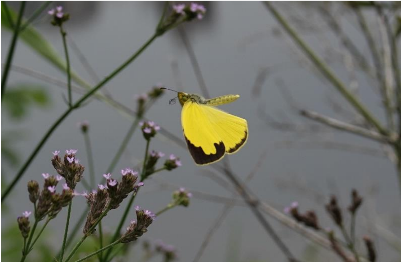
多摩川土手 稲田堤 7月初旬 アレチハナガサに飛来