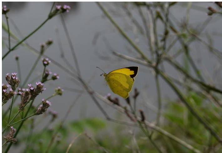
多摩川土手 稲田堤 7月初旬 アレチハナガサに飛来

ハイムでもよく見かける黄色い蝶です。とまると必ず羽を閉じるので、裏よりも格段に美しくはっきりとした表羽の黄色は飛んでいるときにしか確認できないのは残念です。訪花するだけでなく、地面で吸水もしますがすぐに居るのがわかるほど目立つ蝶です。ほかに黄色い蝶としては、キタキチョウによく似たツマグロキチョウ（前羽が尖っているところが違いますが、急激に減少し周辺で見たことはありませんし県内からも消えたとの情報もあります）、また、このあたりでは見られませんが、山地性でキタキチョウより大型のヤマキチョウ、スジボソヤマキチョウがあげられます。