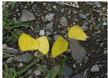
多摩川土手 稲田堤 9月下旬 吸水

ハイムでもよく見かける黄色い蝶です。とまると必ず羽を閉じるので、裏よりも格段に美しくはっきりとした表羽の黄色は飛んでいるときにしか確認できないのは残念です。訪花するだけでなく、地面で吸水もしますがすぐに居るのがわかるほど目立つ蝶です。ほかに黄色い蝶としては、キタキチョウによく似たツマグロキチョウ（前羽が尖っているところが違いますが、急激に減少し周辺で見たことはありませんし県内からも消えたとの情報もあります）、また、このあたりでは見られませんが、山地性でキタキチョウより大型のヤマキチョウ、スジボソヤマキチョウがあげられます。