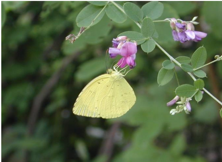
生田緑地 8月上旬 ハギで吸蜜