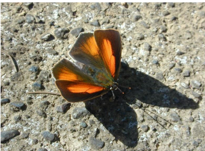
生田緑地 9月中旬♂ いかにも飛翔力の強そうな体型。実際極めて速い