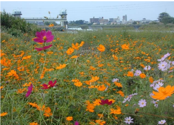
多摩川土手 中野島 10月中旬 キバナコスモスほか