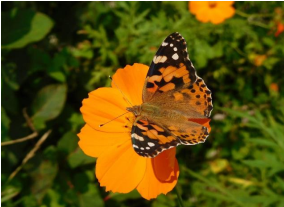
多摩川土手 中野島 9月下旬 キバナコスモスで吸蜜