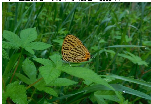
↑ 生田緑地 5月下旬 (27日: 2018年)